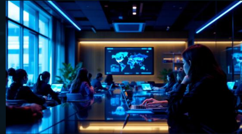
Elektron təhsil platformaları