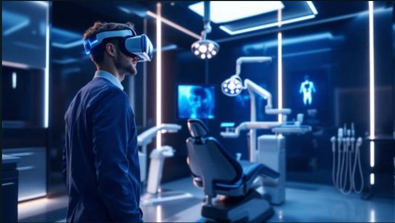
Virtual simulyasiya sistemləri