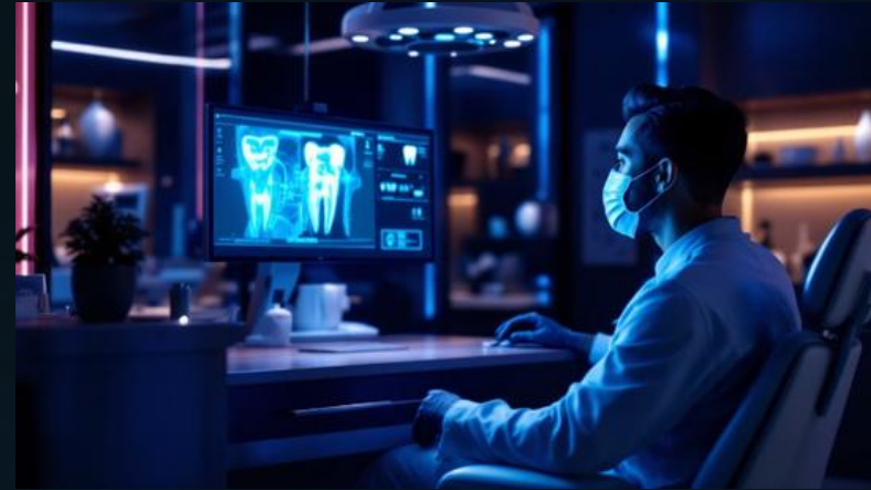
Süni intellekt əsaslı yanaşmalar